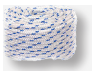
Fune in Polipropilene 30 mt - 10 mm Polypropylene rope 30 m - 10 mm