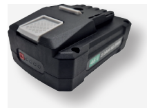
Batteria al litio 48V 2Ah Lithium Battery 48V 2Ah