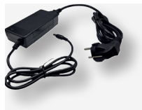
Caricabatterie Charger Cod. K330579