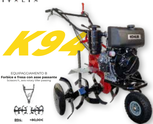
EQUIPAGGIAMENTO B Forbice e fresa con asse passante Scissors h. axis rotary tiller passing