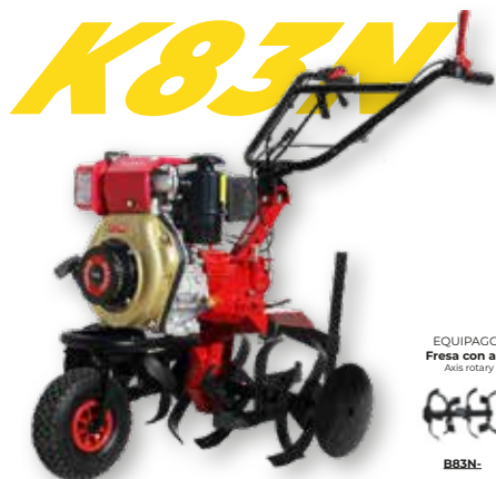
EQUIPAGGIAMENTO B Fresa con asse passante Axis rotary tiller passing B83N: +50,00€